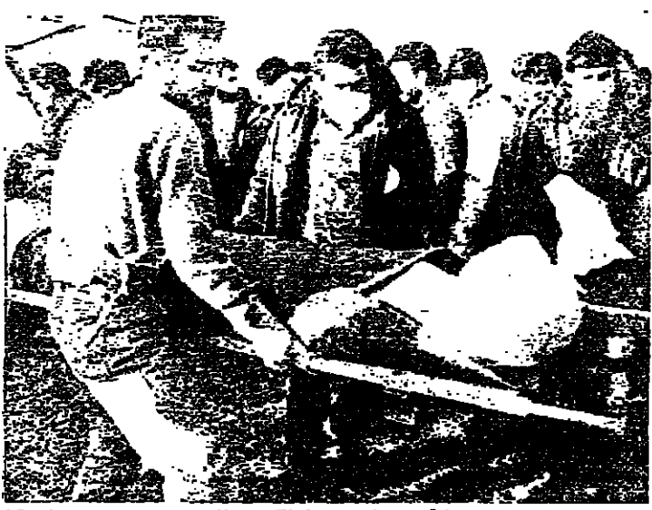
عافية سس الجرحى في القيم التفاح